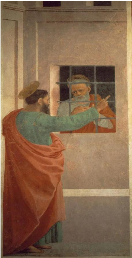
Paul rendant visite à Saint Pierre en prison, par Filippino Lippi (1482), à Santa Maria del Carmine

Les amis, les familles et les responsables religieux sont confrontés à un besoin de plus en plus urgent de réagir face aux arrestations et aux détentions de membres de la communauté par l'ICE . Les alliés en situation régulière et anglophones (comme de nombreux membres du clergé) jouent souvent un rôle crucial dans la coordination du soutien.